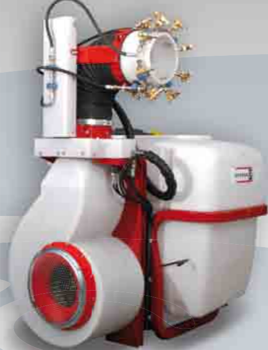
AT Control 660-1100-1650-2200-3300