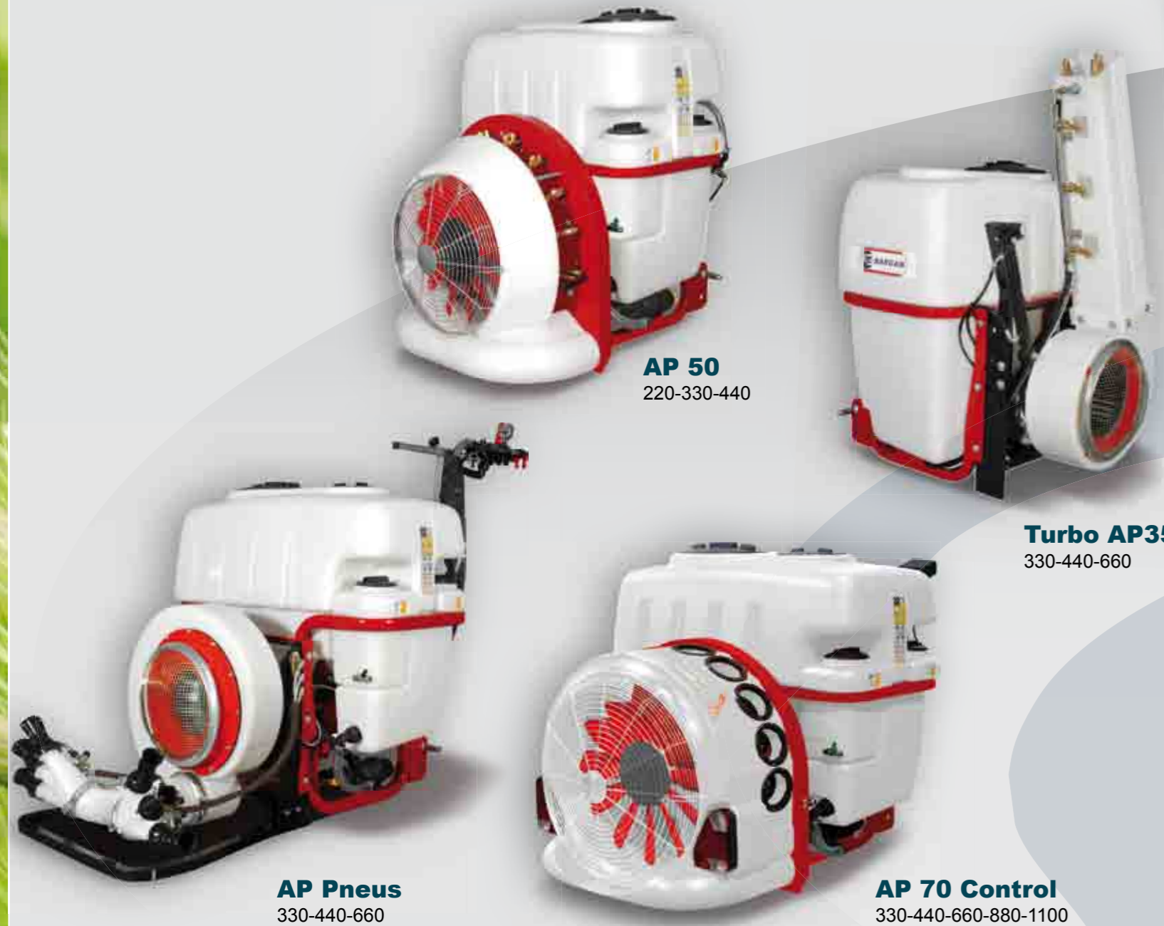
AP 50 220-330-440

🇪🇸 Nebulizadores y atomizadores remolcados de 600 lt a 3000 lt