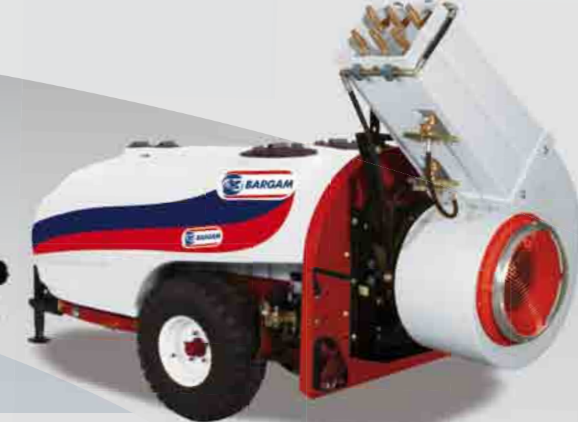
Turbo AT 1100-1650-2200-3300