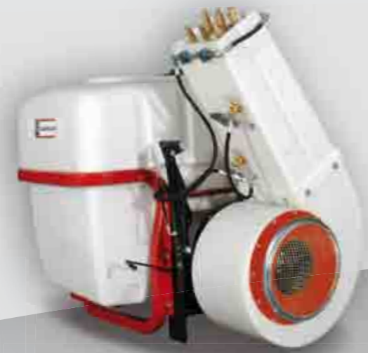
Turbo AP45 440-660-880-1100