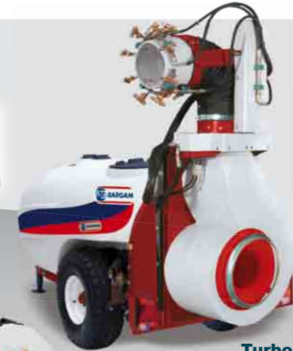
Turbo AT Flex 1100-1650-2200-3300