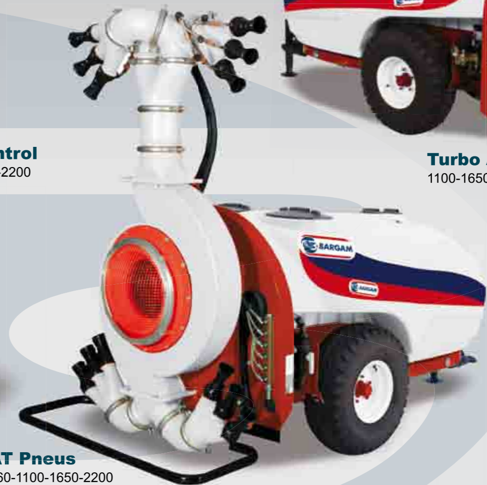
AT Air System 1100-1650-2200-3300