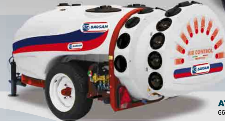
AT Air Control 660-1100-1650-2200