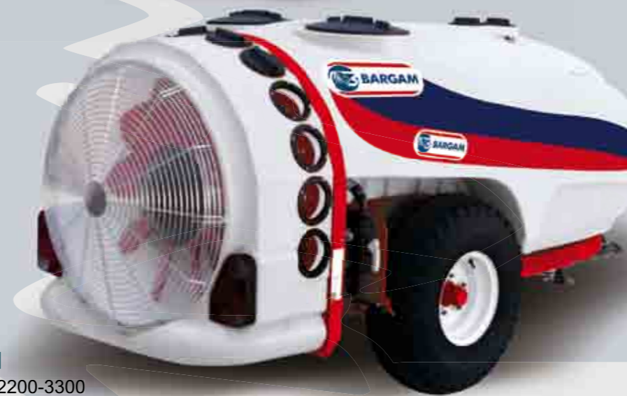
AT Pneus 660-1100-1650-2200