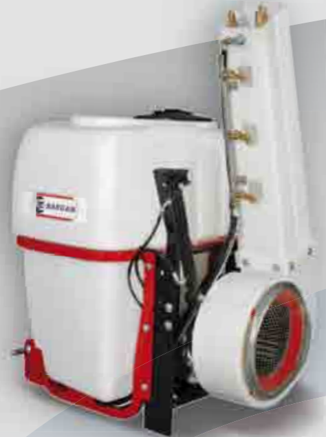
Turbo AP35 330-440-660